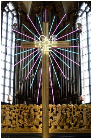
LOVE ME in der Universitätskirche Marburg, 2021, 380 cm × 800 cm × 50 cm (B×H×T), Material: Stahl, Leuchtröhren (LED), Farbfolie, Neonschrift, Gummi, Hochspannungstransformator, verschiedene Elektrokabel, elektronische Schaltung.

© Tizian Baldinger, KBI, 2021, Foto: Benjamin Böhme