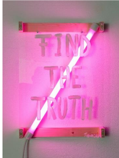
Tizian Baldinger, FIND THE TRUTH, 39 cm × 53 cm × 8cm, Material: Acrylfarbe, Acrylglas, Holz, verschiedene Elektrokabel, elektronische Schaltung.

© Tizian Baldinger, KBI, 2021, Foto: Benjamin Böhme