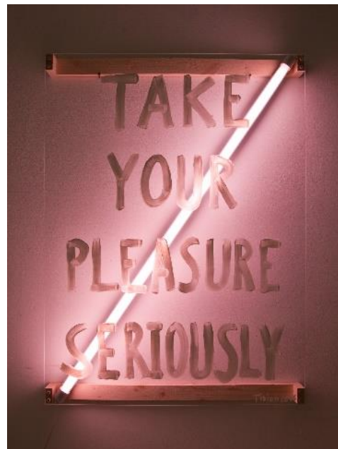
Tizian Baldinger, TAKE YOUR PLEASURE SERIOUSLY, 76 cm × 102 cm × 8cm, Material: Acrylfarbe, Acrylglas, Holz, verschiedene Elektrokabel, elektronische Schaltung.